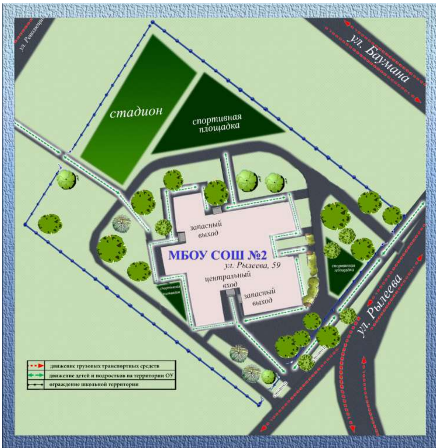
Схема организации дорожного движения в непосредственной близости от МБОУ СОШ №2 с размещением соответствующих технических средств, маршруты движения детей и расположение парковочных мест